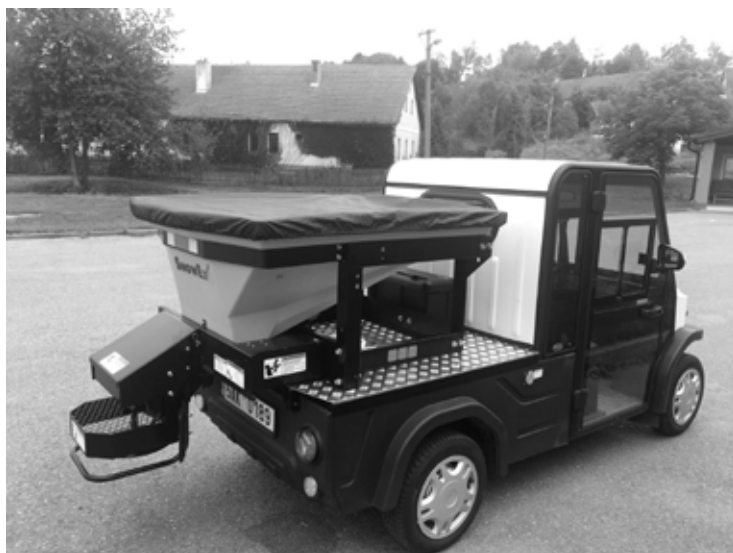
Malé komunální elektrovozidlo navržené S.Štastným